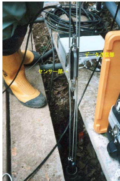
センサー部とデータ送信部