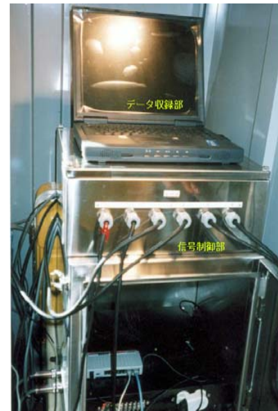
データ収録部と信号制御部